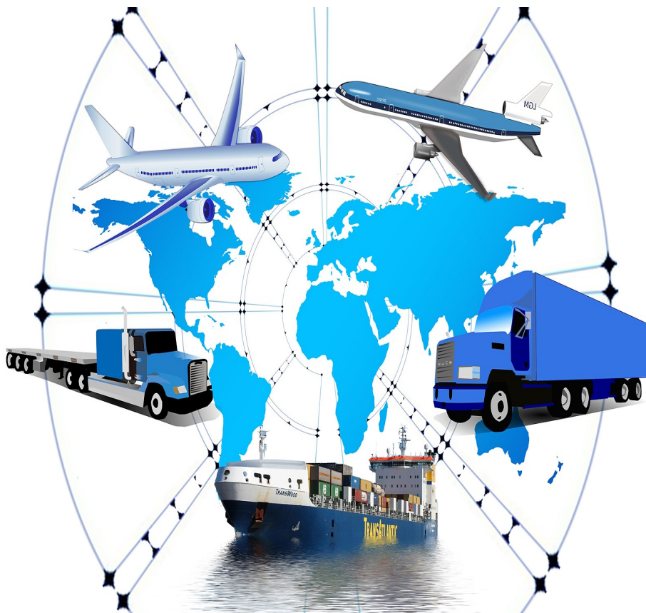
Imagem ilustrando os principais meios logísticos do mundo.