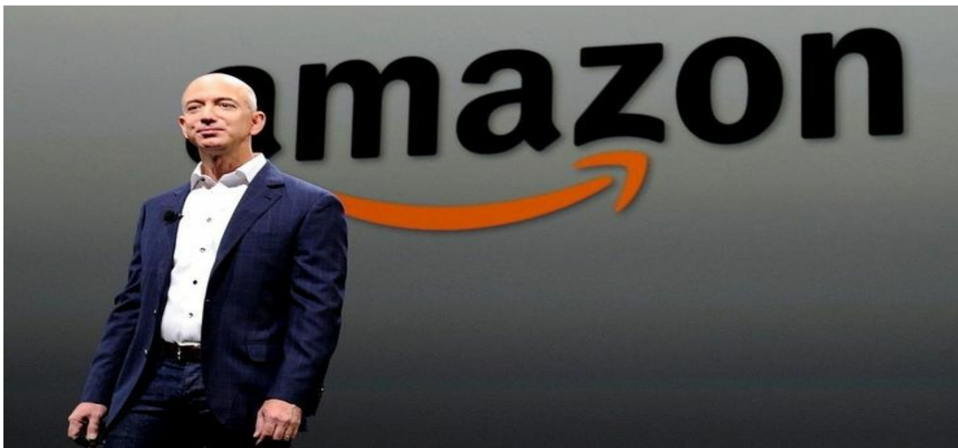
Foto: Jeff Bezos, fundador da Amazon durante sua palestra.